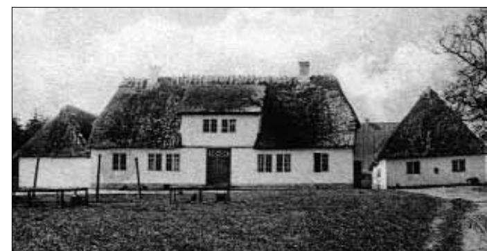
Æbeløgaard 1905