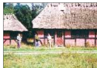
I stuehuset til "skovfogedhuset" boede lærerinden i den ene ende og skolen var i den anden. ③