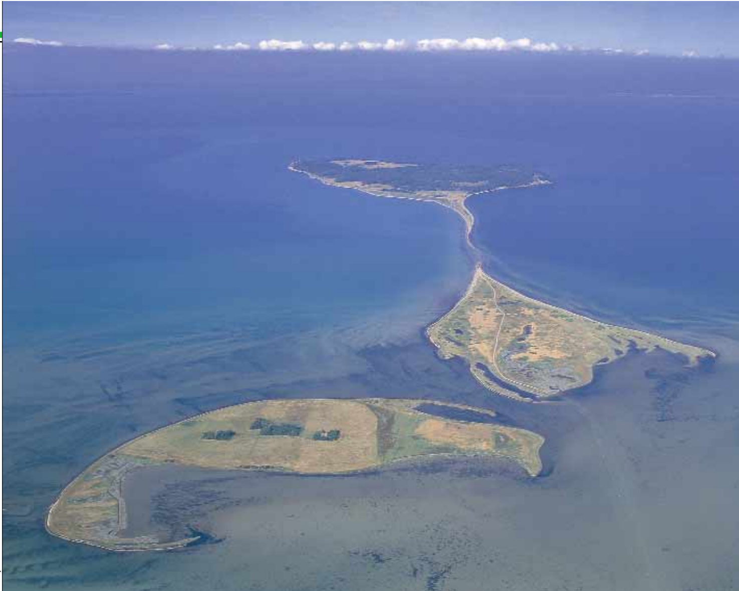
Æbelø, Æbelø Holm og Dræet. På Dræet (forrest i billedet) ses stadig de gårde der blev forladt i 1960'erne

Helt unikt er det 55–60 millioner år gamle mørkegrå Æbelø Ler fra tertiærtiden. Leret ses smukkeste i klinten nordvest for Østerhoved Spids ⑨, hvor de lyse, forkislete lag og de mørke lerede lag er foldet op i en bue, men findes også ved den tidligere havn, Skibsdal og Tjørnehule. Leret fra tertiærtiden har et højt indhold af mineralet smectit, der har en fænomenal evne til at suge vand. Når det bliver vådt bliver det blødt som vælling og kan ved kysterne skride ud i havet i store lertunger. Der er tit revet træer med ned på strandbredden. Øen er en internationalt kendt lokalitet for disse leraflejringer.